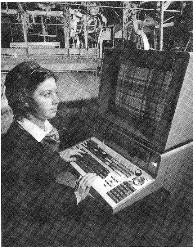
Die Komplexität des auf diesem Computerterminal gezeigten buntkarierten Schottenstoffes ist ein Beispiel für die vielfältige Verwendbarkeit des neuen Webarten-Simulationsprogrammes, das es den Textildesignern ermöglicht genau vorherzusagen, wie ein neues Muster aussehen wird.

Die erste Verbesserung ist die, dass die Palette der Farbzusammenstellungen jetzt 16,7 Millionen einzelne Kombinationen enthält – d.h. es sind mehr Farben vorhanden, als sie vom menschlichen Auge wahrgenommen werden können. Die zweite Verbesserung besteht darin, dass anstelle der in 16 Farben gehaltenen Bildschirm-Darstellung jetzt Darstellungen in 32, 64, 128 oder 254 Farben möglich sind; wobei die erste als in der Regel ausreichend angesehen wird. Allerdings können sämtliche Farbzusammenstellungen in der genannten Farbenzahl in der abschliessbaren Konsole des Computers abgelegt werden. Die dritte Verbesserung besteht in der Steigerung der Auflösung auf eine Breite von 1024 Fäden bei einer Höhe von 768 Fäden, die mit einer maximalen Einstellung von 30 Fäden/cm auf einer 3,4 m breiten Fläche gezeigt werden. Die Darstellung grösserer Musterabmessungen ist ebenfalls möglich.