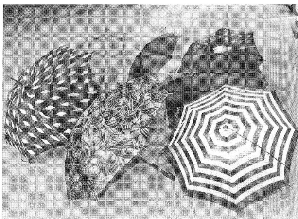
Ein bunter Strauss Schweizer Schirme