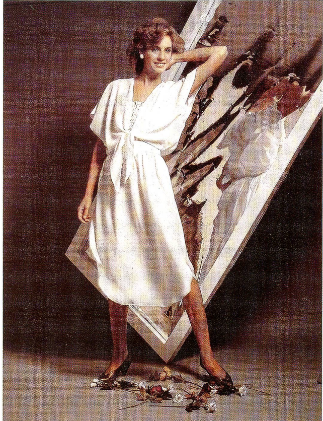
Dreiteiliges, weisses Tersuisse-Kleid: Die elastisch, gesmokte Corsage wird durch das geknotete Oberteil und dem raffinierten Wickeljupe ergänzt.

Die Abendmode gibt sich kostbar und prunkvoll. Die Schnitte sind einfach und raffiniert und überlassen den Stoffen das Brillieren.