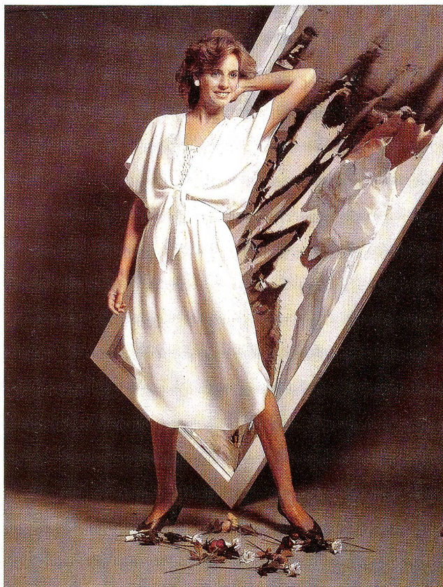
Dreiteiliges, weisses Tersuisse-Kleid: Die elastisch, gesmokte Corsage wird durch das geknotete Oberteil und dem raffinierten Wickeljupe ergänzt.

Die Abendmode gibt sich kostbar und prunkvoll. Die Schnitte sind einfach und raffiniert und überlassen den Stoffen das Brillieren.