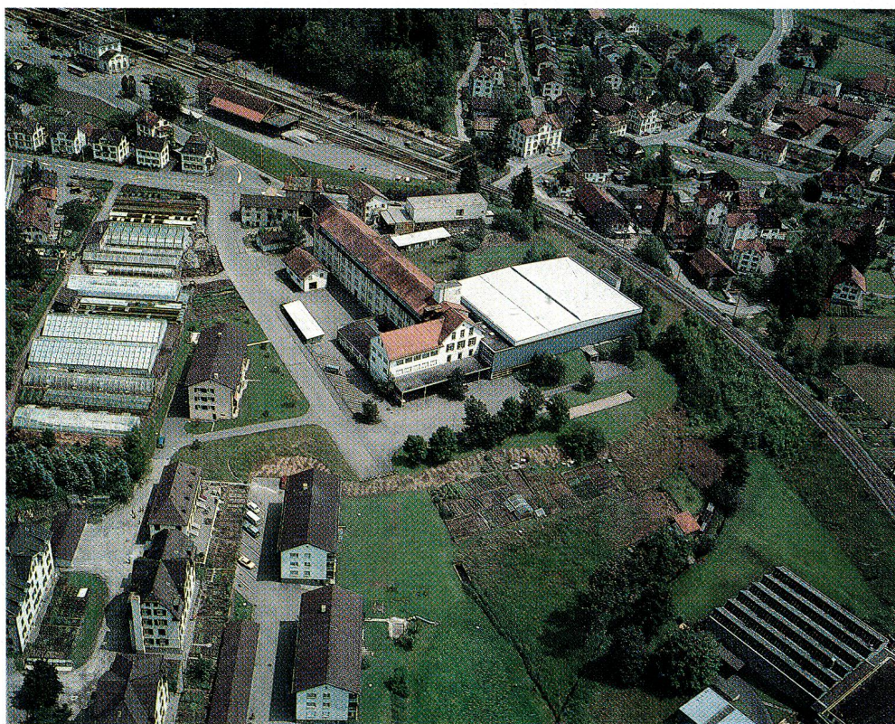
Flugbild der Weberei am Produktionsstandort in Wald; diese Fabrikliegenschaft wurde 1968 erworben.

Keller & Co. AG, Gibswil: Blick hinter die Gardinen