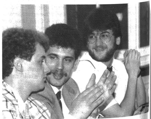
Freude unter den neuen Technikern TS

Bei hochsommerlichen Temperaturen empfangen am Freitag, 3. Juli im Hörsaal der Schweiz. Textilfachschiule Zürich 67 Studentinnen, Studenten und Absolventen von Blockkursen Ihre Diplome nach erfolgreich bestandener Schlussprüfung.