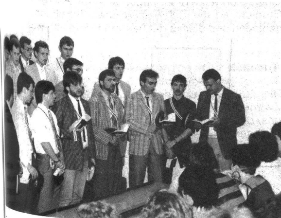
Ständchen in Ehren ... die Aktivitas Textilia