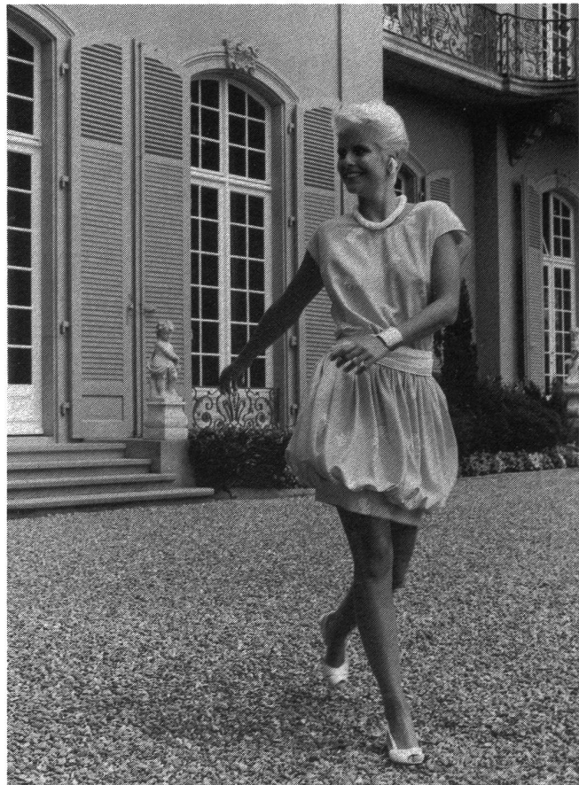
Gelb-weiss bedrucktes Tersuisse-Kleid mit aktueller tiefer Taille und lustigem Ballonjupe.

Modell: Albery SA, CH-1003 Lausanne Accessoires: A. Schlegel, CH-8953 Dietikon Schuhe: Bally AG, CH-5010 Schönenwerd