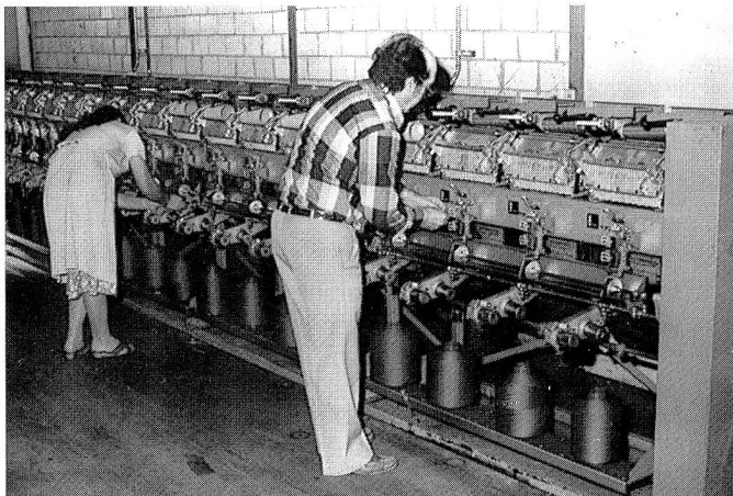
Neue Schweiter-Digiconer mit je 24 Spulstellen in der Um- und Endspulerei

Mit einem Drittel der heute total 230 Beschäftigten «verarbeitet» die WT Wäscherei Thalwil AG heute täglich etwa 11 Tonnen Spitalwäsche, die aus den kantonalen Spitälern angeliefert wird. Während des stark automatisierten Wasch- und Aufbereitungsvorganges wird nach einem Vorsortierungsvorgang die Spitalwäsche gemäss Vorschrift der Gesundheitsdirektion Zürich gewaschen. Auch in diesem Sektor hat sich das Unternehmen besonders Wissen und Können erarbeitet: ein selbst entwickelter Jet-Finisher wurde eine Zeitlang produziert und verkauft. Heute wird er noch anderswo in Lizenz weiterfabriziert, da sich die VFA doch als Garnveredelungsunternehmen und nicht als Maschinenfabrik versteht. Eine letzte Ziffer sei erwähnt, wird doch etwa ein Drittel des gesamten kantonalzürcherischen Spitalwäschebedarfs in Thalwil gewaschen und wiederaufbereitet.