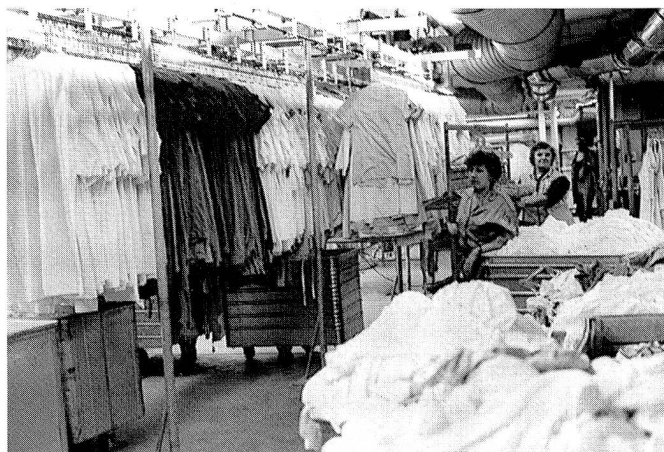
In den Betriebsablauf harmonisch eingegliedert ist die (Spital-)Wäscherei-abteilung, in der ein Drittel des Personalbestandes beschäftigt ist.

Nach dem Färbeprozess erfolgt das Trocknen mittels eines besonders schonungsvoll arbeitenden Hochfrequenz Trockners. Wertmässig haben Seidengarne im Umsatz den höchsten Anteil, quantitativ sind dagegen Baumwolle, Viscose, Azetat und Polyester überwiegend. Ferner pflegt VFA, für Seidengarne unentbehrlich, auch eine Strangfärberei. Die gesamte Garnveredelungsproduktion bezifferte sich 1987 auf rund 600 t, davon entfielen auf Seide zwischen 180 und 200 t.