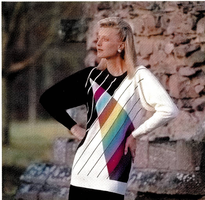
Ein Prunkstück aus der modischen Kollektion Ballantyne bei Gassmann, Zürich.