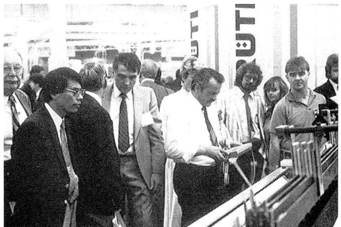
Bevorzugter Anziehungspunkt an der American Textile Machinery Exhibition International in Greenville in den USA: Der Stand der Sulzer Rüti Inc.