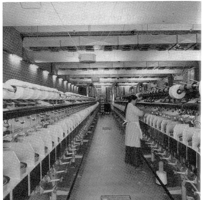
Grossräumigkeit bei wenig Personal, ein Charakteristikum moderner Textilbetriebe. Wenige Leute, welche eine gefährliche Brandentwicklung frühzeitig erkennen könnten. Deshalb ist die automatische Brandüberwachung ein absolutes Muss.

Die Geometrie des Baues war gegeben: Es handelte sich um ein einstöckiges Gebäude mit einer Halle von rund 50 × 150 m Länge bei einer lichten Höhe von 7/7,5 m, mit einem grossen Unterzug in der Längsachse und kleineren, darauf abgestützten, woraus sich jeweils Deckenfelder von rund 5 × 25 m (halbe Breite) ergaben. Die Skizze Fig. 1 erläutert die Verhältnisse.