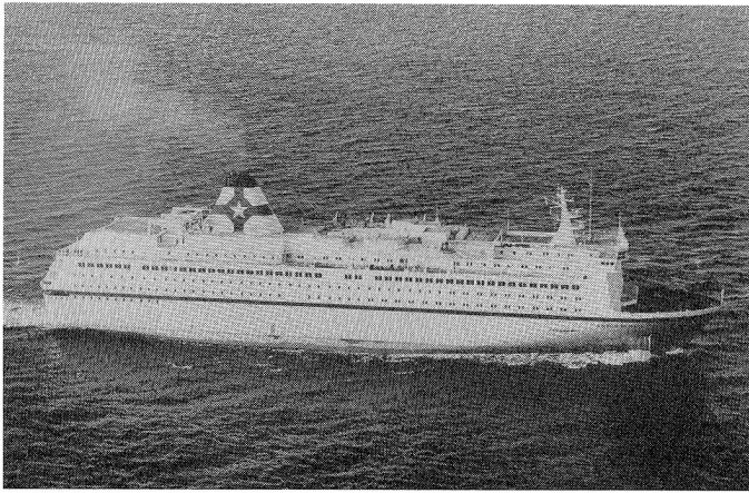
Das neue Fährschiff «Kronprins Harald», ausgerüstet mit Temperatur-Regelsystemen von Landis & Gyr, auf seiner Jungfernfahrt zwischen Kiel und Oslo.

Zwischen Kiel und Oslo werden durch die Schiffe dieser Gesellschaft täglich bis zu 2300 Passagiere und 1300 Pkws befördert.