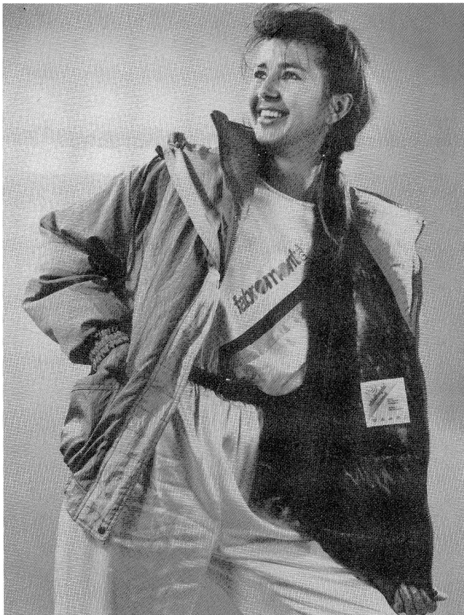
Photo Fabromont AG, CH-3185 Schmittlen, Modell «IMAGINATION» Claude Dhiet, B-8000 Brugge

ten Daunen enthalten. Auch über das Mischungsverhältnis von Daunen und Federn bleibt der Konsument meist im unklaren. Die im freiburgischen Schmittlen ansässige fabromont AG entwickelte und fabriziert neu die dreamball Füllung für modische, wärmespendende Schutzbekleidung aus 100% Spezialsynthetik. Das neue, wie Daunen einblasbare Füllmaterial dreamball ist luftig, locker und daunenweich, leicht und dennoch ein hervorragender Schutz gegen Kälte. Es ist maschinenwaschbar, tumblerfest und selbst nach einem Sturz in einen Bergbach rasch wieder trocken. Auch für Stauballergiker bleibt es problemlos. Anoraks mit dieser dauerelastischen Füllung sind optimal anschmiegsam. Sie sind mit der Marke dreamball ausgezeichnet, damit der Konsument weiss, welchen Inhalt er kauft.