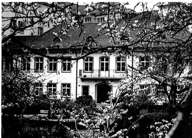
Am Hauptsitz der Desco von Schulthess AG, an der Brandschenkestrasse in Zürich, laufen die Fäden der weltweiten Aktivitäten zusammen.