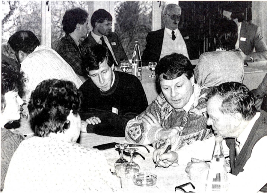
«Me mues halt rede mitenand.» Engagierte Diskussionen unter den Kursteilnehmern über das Wie und Was der Konfliktlösung.

wandte Kompromiss die denkbar schlechteste aller Lösungen. Beide haben etwas, sind aber doch nicht restlos zufrieden. Wer kennt nicht das Wort vom «faulen Kompromiss» oder «Kuhhandel». Nach folgenden Kriterien sollte die Lösungsstrategie gesucht werden: Der notwendige Zeitaufwand, die langfristige Wirksamkeit, die Qualität der zwischenmenschlichen Beziehungen sowie die Identifikation der beteiligten Partner mit der Lösung. Die vom Referenten angebotenen Strategien wurden nun, anhand von eigenen erlebten Konfliktsituationen, angeregt in verschiedenen Gruppen besprochen und ausgearbeitet. Und was für Strategien gibt es dafür?