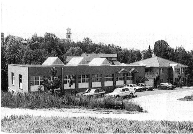
Der vor Jahresfrist bezogene Neubau mit Verwaltungstrakt