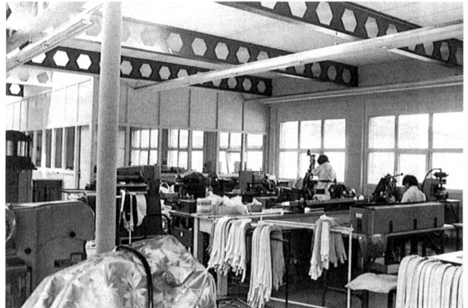
Heller und freundlicher Fabrikationsraum auf 360 m 2 Fläche

Das Unternehmen beschäftigt gut 25 Personen und stellt pro Jahr rund eine Viertelmillion Gürtel her. Drei Viertel der Produktion entfallen auf Ledergürtel, der Rest auf Textil- und Kunststoffmaterialien. Für die Ledergürtel werden vor allem hochwertige Spaltleder und Softina-Rindleder verarbeitet, in geringem Ausmass auch Wildleder und andere Spezialleder. Neben Gürteln werden ausserdem in kleinem Umfang noch Knöpfe produziert.