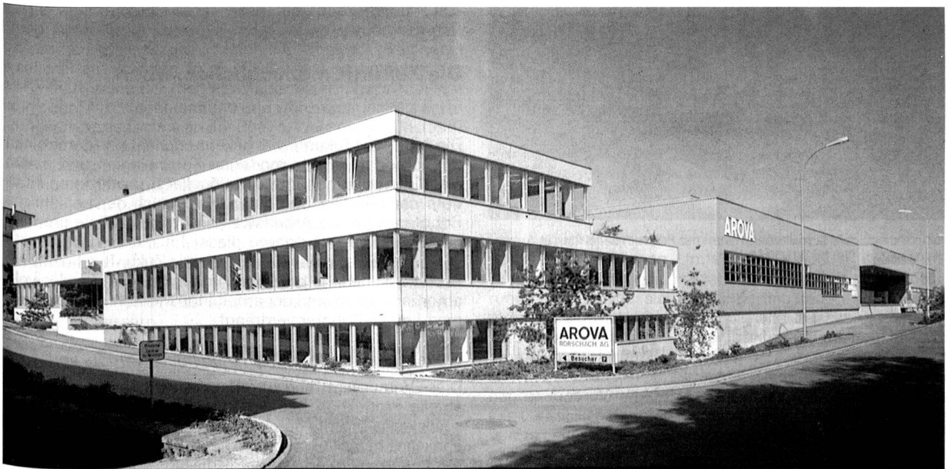
Produktion und Verwaltung der Arova Mettler AG in der an die Rorschacher Triopan AG, veräusserten Liegenschaft. Arova Mettler ist wie bisher Mieter, vorheriger Besitzer war die Arova Immobilien AG.

Arova Mettler AG, Rorschach – Arova-Nähzwirne unter neuem Dach