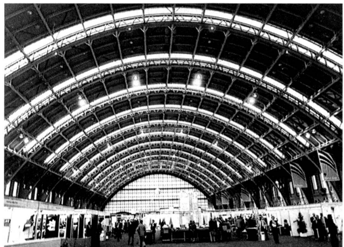
Blick ins Innere der riesigen, trägerlosen Ausstellungshalle.

Nach Aussagen der Messeleitung war die Grundidee, der britischen Textilindustrie eine Gelegenheit zu bieten, sich einmal im Jahr zu einer Leistungsschau zu treffen. Es liegt aber durchaus im Bereich des Möglichen, dass die jährliche Ausrichtung einem 2-Jahres-Rhythmus weichen wird. Dies wurde von verschiedenen Ausstellern gewünscht. Der Begriff «internationale Ausstellung» trog, der Anlass zielt nur auf den britischen Markt. In bekannt englischer Manier herrschte in der riesigen Halle eine Atmosphäre ohne Hektik. Umso wichtiger die Qualität des Fachpublikums, welche nach Aussagen der befragten Aussteller gut bis sehr gut war. Unternehmen, die am britischen Markt interessiert, oder schon präsent sind, sollten sich eine Beteiligung überlegen, hier trifft sich alles. Ein Schweizer Besucher: «Hier trifft man viele Kunden, sei es als Besucher oder Aussteller. Viele Reisetage können hier eingespart werden.»