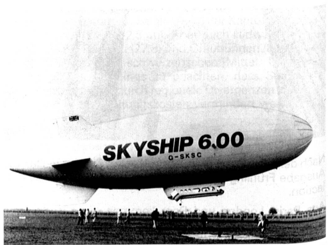
Spektakuläres Einsatzgebiet für technische Textilien: Der Radar Zeppelin Skyship 5000.

Unbestritten ist, dass in Europa ein hohes Forschungs- und Entwicklungsniveau für technische Textilien vorhanden ist. Hinsichtlich der Anwendung neuer Werkstoffe sei man aber in den USA und Japan bereits viel weiter, schätzt die Messeleitung. In diesen Märkten beträgt der Anteil technischer Textilien an der Gesamtproduktion bereits knapp 25%, und bis zum Jahr 2000 soll er auf 50% steigen. Technische Textilien erfordern ein hohes Mass an zusätzlicher Information für den Anwender. Und diese Informationen sind noch nicht genügend verbreitet. Die Techtexil will ihren Teil mit einem Symposium beitragen.