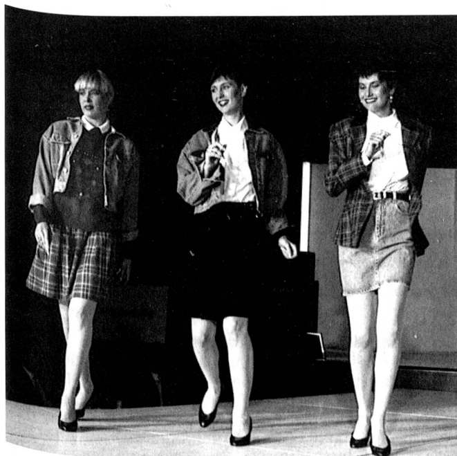
Im weltweit wachsenden Markt der Freizeitbekleidung nimmt der Denim eine dominierende Stellung ein.

Im weltweit wachsenden Markt der Freizeitbekleidung nimmt der Denim heute eine dominierende Stellung ein. Seit den fünfziger Jahren, als Marlon Brando und James Dean die Blue jeans hoffähig machten und der Denim seinen Siegeszug um die Welt antrat, hat er sich zu einer Mode entwickelt, die in ihrer Vielfalt und dank des Ideenreichtums der Modeschöpfer, der Garnhersteller, Weber, Ausrüster und Konfektionäre ihresgleichen sucht (Abb. 1).