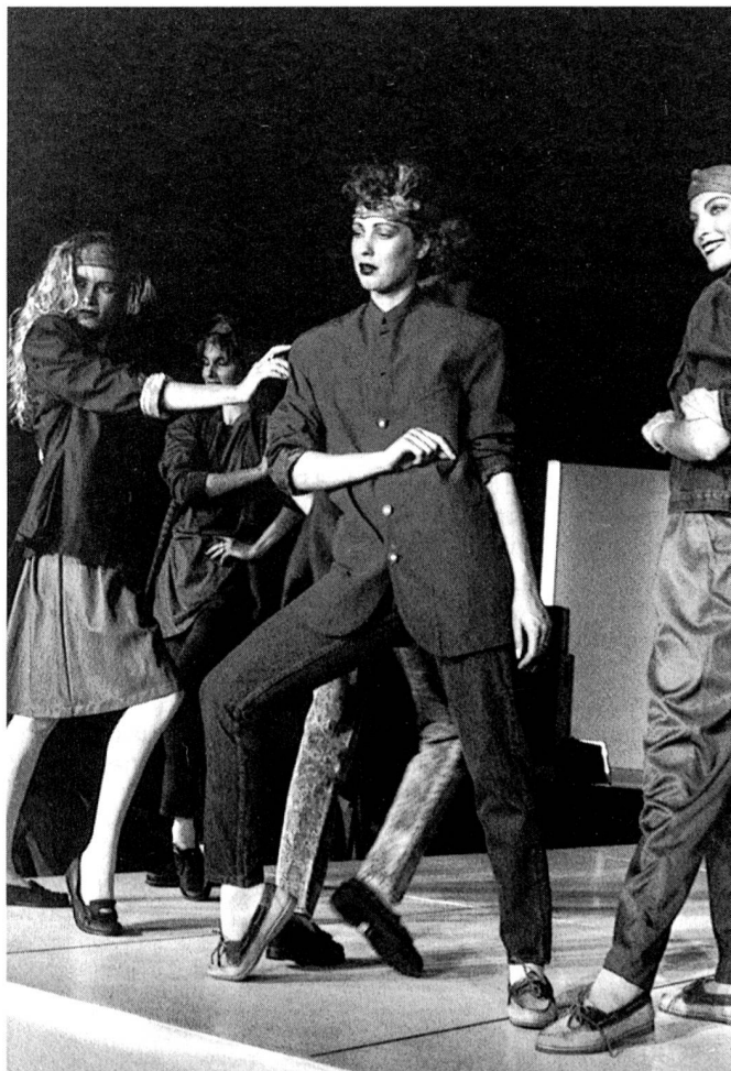
Gefragt sind neben den schweren Denimqualitäten auch leichte bis mittelschwere Gewebe, Twill und Chambray, für Blusen, Hemden, Shirts und Jacken.

Ursprünglich wurde der ausserordentlich strapazierfähige Baumwollstoff aus indigogefärbter Baumwolle in der Kette und rohweisser Baumwolle im Schuss als Tissus de Nimes in der Region von Nimes im französischen Rhonetal hergestellt. Später machte Levi Strauss, der 1873 von Deutschland in die Vereinigten Staaten emigrierte, Denim in Amerika bekannt und so populär, dass sich beispielsweise alle Einwohner der Stadt Erwin in North Carolina in Denim kleideten und die Stadt 1976 mit einer Medaille als «The Heart of Denim» ausgezeichnet wurde.