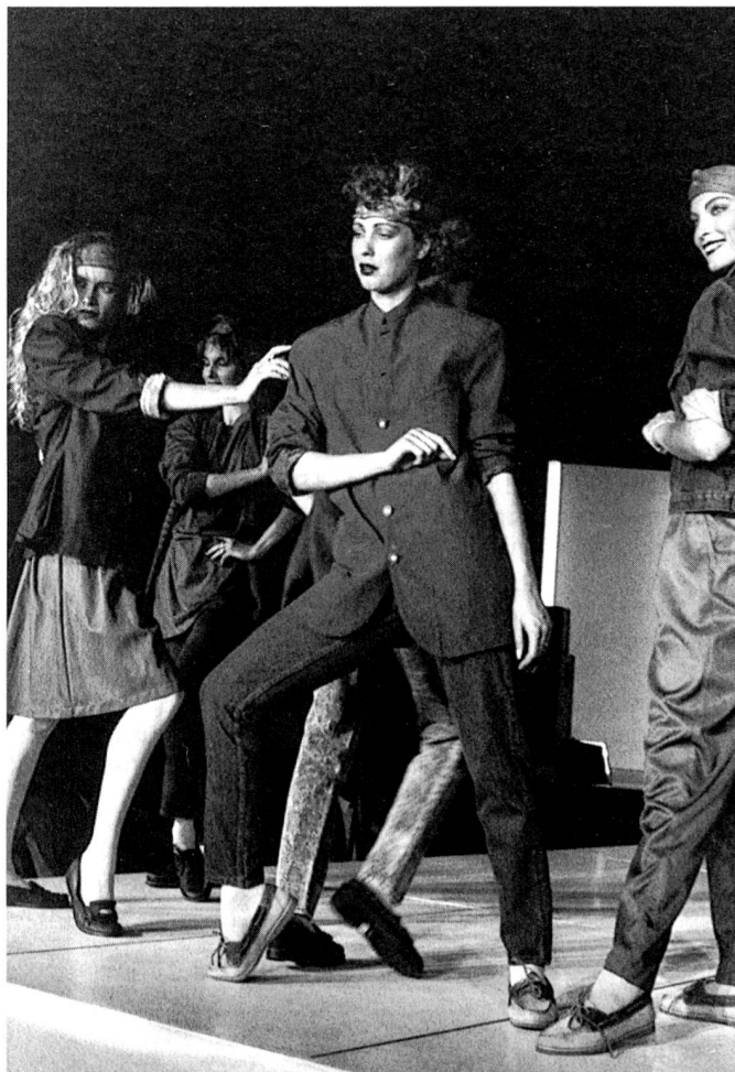
Gefragt sind neben den schweren Denimqualitäten auch leichte bis mittelschwere Gewebe, Twill und Chambray, für Blusen, Hemden, Shirts und Jacken.

Ursprünglich wurde der ausserordentlich strapazierfähige Baumwollstoff aus indigogefärbter Baumwolle in der Kette und rohweisser Baumwolle im Schuss als Tissus de Nimes in der Region von Nimes im französischen Rhonetal hergestellt. Später machte Levi Strauss, der 1873 von Deutschland in die Vereinigten Staaten emigrierte, Denim in Amerika bekannt und so populär, dass sich beispielsweise alle Einwohner der Stadt Erwin in North Carolina in Denim kleideten und die Stadt 1976 mit einer Medaille als «The Heart of Denim» ausgezeichnet wurde.