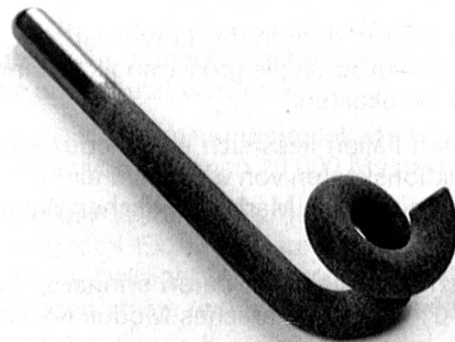
Verschleisschutz durch Beschichtung Wear Protection by Coating

Auch in der Textilindustrie gewinnt das Plasmaspritzverfahren zunehmend an Bedeutung. Steigende Fadengeschwindigkeiten und das Verlangen nach höherer Betriebssicherheit stellen immer grössere Ansprüche an Verschleisswiderstand und Reibungsverhalten der Funktionsteile. Oxid-Keramikbeschichtungen auf Al_2O_3 -Basis haben sich bei fadenführenden Bauteilen besonders bewährt.