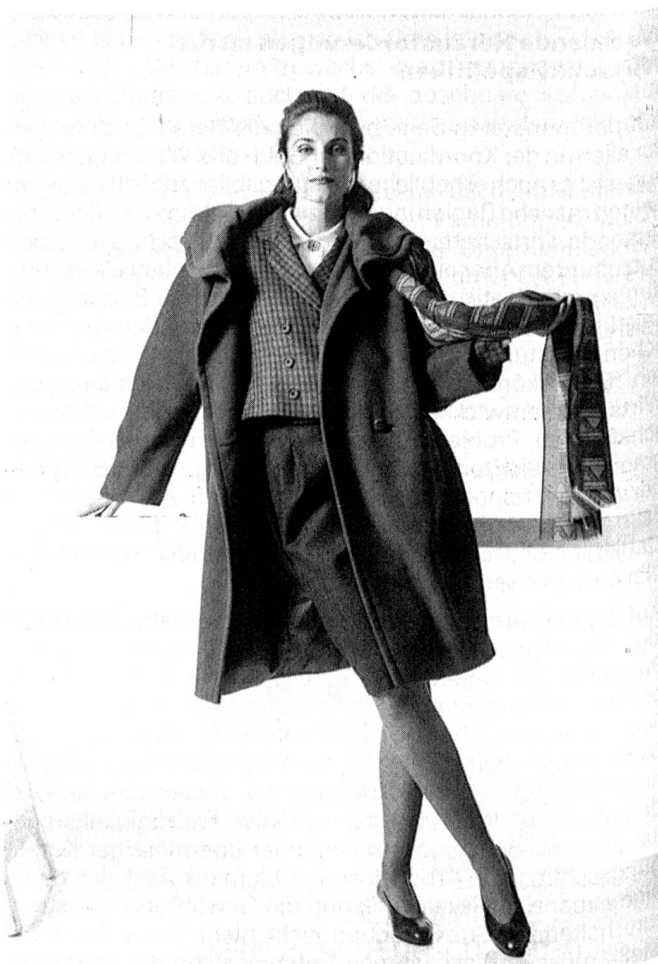
Exklusive Kombination von Mabb, Jacke, Jupe, Mantel Feldpausch Zürich

Unter dem Namen «Hunting Chic» präsentiert sich feminin-sportliche Mode in edlem Jagdstil. Hochwertige Stoffe in Tweed-Optik und Shetlands betonen dieses Bild. Wunderschöne Töne in den Farben des Waldes, reifer Früchte oder schweren, dunklen Weines werden nach neuem Farbverständnis, innerhalb einer Farbfamilie kombiniert. Hell mit Dunkel, kalte mit warmen Tönen.