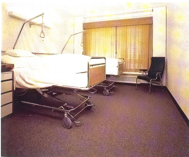
Bei der Wahl von Teppichböden in Krankenhäusern stehen hygienisch-bakteriologische Fragen sowie die Gestaltung von Raumatmosphäre, Trittsicherheit und Unfallschutz im Vordergrund.

Im städtischen Krankenhaus Witikon wurden im Jahre 1983 ca. 6000 m 2 Teppichböden Tiara compact verlegt. Die Farbgebung wurde nach Wünschen des Architekten, Herr Dr. F. Krayenbühl, Zürich, speziell auf das Gesamtkonzept abgestimmt. Belegt mit Teppichen wurde mit Ausnahme von ärztlichen Spezialräumen, WC und Nasszellen, die Gesamtfläche mit dem gleichen Produkt und derselben Farbstellung. Nach sechs Jahren voller Nutzung kann die Betriebsleitung ein positives Urteil bestätigen, und die Erwartungen, welche an die Bodenbeläge gestellt wurden, werden voll erfüllt.