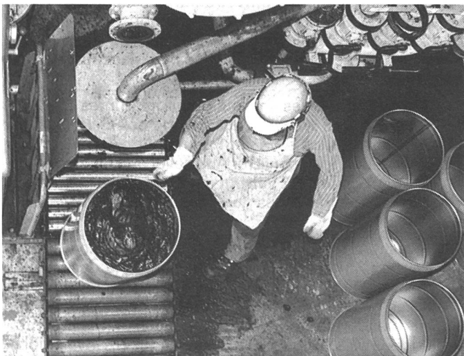
Indigo wird heute immer noch grosstechnisch hergestellt. Vier grosse Produzenten gibt es weltweit. Die BASF in Ludwigshafen, der es als erster gelang, diesen blauen Farbstoff zu synthetisieren, zählt zu den ganz Grossen.

Zahlreiche Forscher machten sich an die Arbeit. Es gelang, Anilin aus dem Teer zu gewinnen, der bei der Verkokung von Steinkohle entstanden war. Erfolge blieben nicht aus. Viele Farbstoffe liessen sich synthetisieren, doch Blau war nicht dabei. Dem Hochschullehrer Adolf von Baeyer gelang es als erstem, das chemische Grundgerüst des Indigo zu entschlüsseln. Nachdem die Molekülstruktur erst einmal bekannt war, liess der nächste Schritt nicht lange auf sich warten: Im März 1880 wurde ihm vom Reichspatentamt für den von ihm gefundenen – allerdings nicht praktikablen – Syntheseweg ein Patent erteilt. Man hatte «Blau gelect»; weitere neue Synthesewege wurden entdeckt – unter anderem auch vom Zürcher Professor Karl Heumann. Am 6. Mai 1890 liess er sich seinen Weg patentieren, den die damalige Badische Anilin- und Sodafabrik, die heutige BASF, nach weiteren sieben Jahren intensiver Forschung und Entwicklung technisch umsetzen konnte. Der erste künstliche Indigo war auf dem Markt. 18 Millionen Goldmark – mehr als das damalige Grundkapital der Gesellschaft – hatte die BASF in dieses Projekt gesteckt.