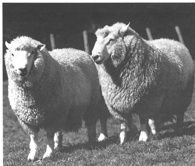
Krause Wolle mit sehr wenig medullierten Fasern wird vom Perendale-Schaf produziert. Die Ohren des Perendale, die in einem exakten 45-Grad-Winkel absteigen, sind ein wichtiges Erkennungsmerkmal.

Als «pflegeleichtes Schaf» bezeichnet, war das Perendale ideal für das noch eher unberührte Hügelland. Von der Cheviot-Seite her stammte es von einer Züchtung ab, die es gewohnt war, sich in den rauen Grenzgebieten von Schott-