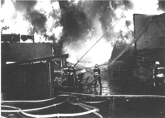
Eine erfolgreiche Brandbekämpfung setzt entsprechende Brandmeldesysteme voraus. Das STI-System bedeutet den Einstieg in eine neue Generation dieser Technologie.

Der Mikrocomputer in der Zentrale betreut auf einem Einschub vier Meldelinien mit bis zu 32 Sensoren. Diese liefern nun kein Alarmsignal mehr, sondern ein der Brandkenngrösse analoges Signal, den Messwert. Dieser richtet sich nach den Umgebungsbedingungen wie Feuchtigkeit, Luftdruck, Temperatur und Aerosolgehalt der Luft. Jeder Messwert wird mit Hilfe der Einzelidentifizierung dem jeweiligen Sensor zugeordnet und individuell verarbeitet. Defekte Sensoren werden sofort erkannt und eine gezielte Auswechslung ermöglicht, ohne dass die Anlage abgeschaltet werden muss.