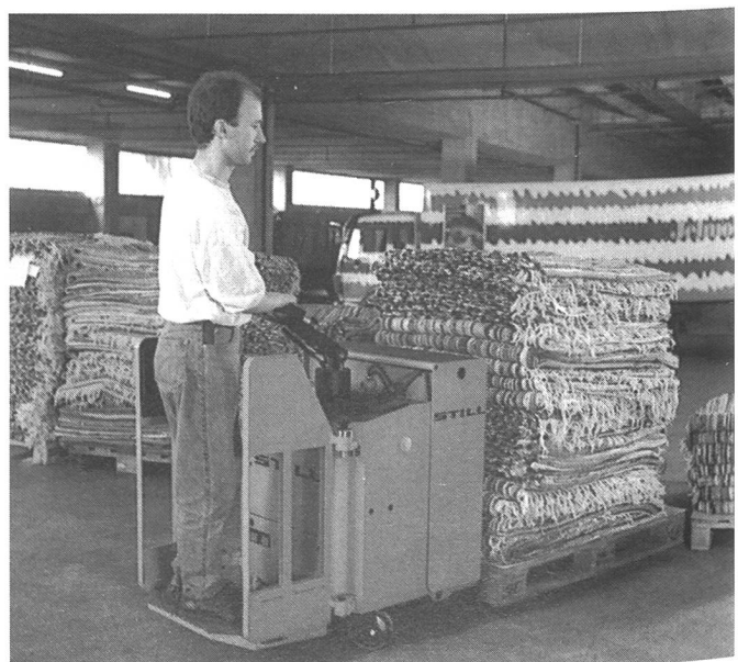
Der neue Elektro-Gabelhubwagen mit Fahrerplattform

Der Benutzer eines herkömmlichen Elektro-Gabelhubwagen leistet mitunter Beträchtliches, namentlich bezüglich der zurückgelegten Wegstrecke. So beträgt die technische Leistungsfähigkeit eines gängigen Elektro-Gerätes durchschnittlich 16 km pro Schicht. Im Mitgängerbetrieb geführt, addiert sich dies für den Bediener - Hin- und Rückweg gerechnet - auf 32 Kilometer. Mit dem neuen Elektro-Geh-Gabelhubwagen Modell EGU-S zeigt Still einen anderen Weg, wie solche «Gewaltmärsche» sinnvoll eingeschränkt werden können.