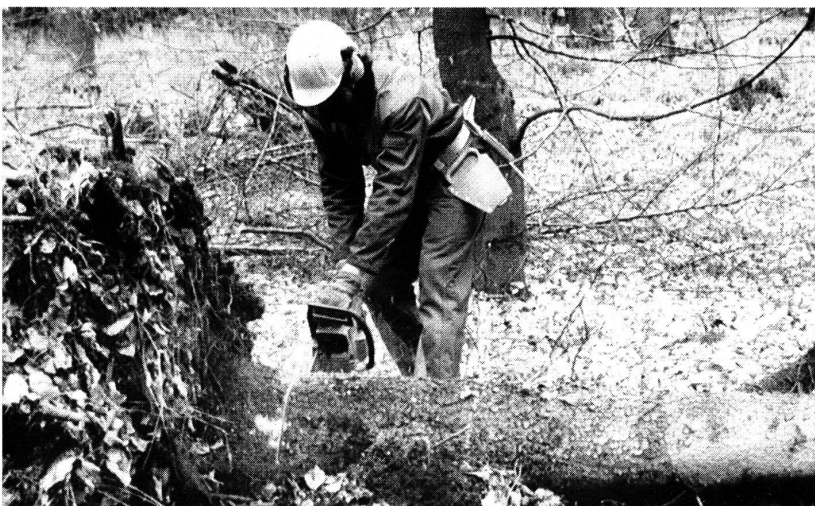
Textilien schützen Waldarbeiter vor schweren Verletzungen. Erreicht wird das mit einem Kniff. Die Arbeitsanzüge werden mit einer Schnittschutzeinlage ausgestattet, die aus mehreren Schichten langer Fäden besteht.

die in mehreren Schichten übereinander liegen. Rutscht einem Arbeiter die Motorsäge aus und reißt die Schutzkleidung auf, wickeln sich diese Fäden in die Kette der Säge. Das Gerät bleibt stehen.