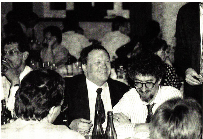
Wie immer spielt der Kontakt mit gleichgesinnten Textilern und Freunden eine wesentliche Rolle an der GV.

In 10 kompetent geführten Gruppen wurde der Betrieb mit seinen drei