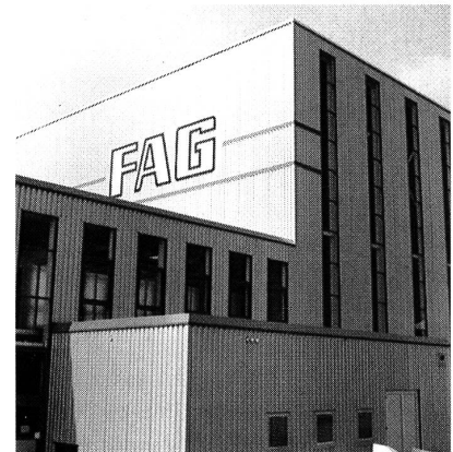
Das neue Produktions-, Logistik- und Bürozentrum von FAG (Schweiz) in Oberglatt

Die SRO Kugellagerwerke J. Schmid-Roost AG werden Anfang August ihre neuerstellten Geschäftsgebäude in Oberglatt beziehen. Gleichzeitig wird auch der Firmenname in FAG (Schweiz) geändert.