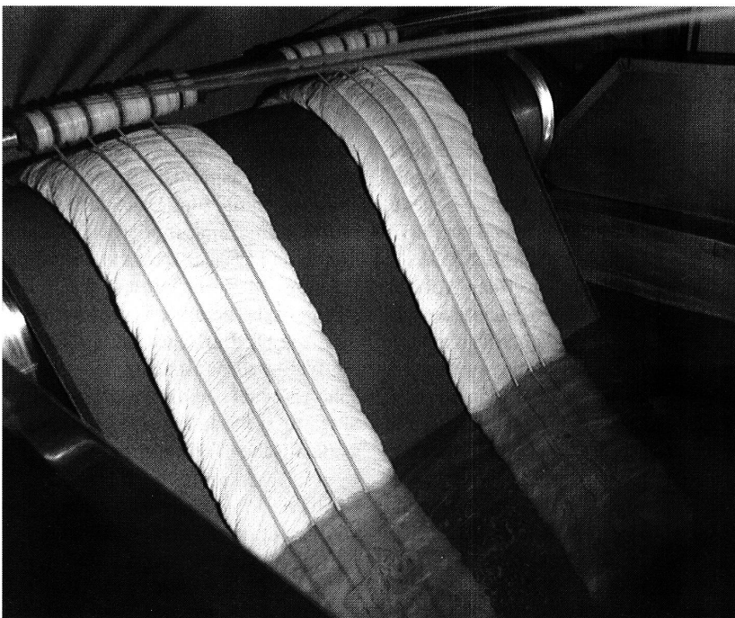
Das mit dem Chemset-Verfahren behandelte Garn verlässt das letzte Bad. Die gleichmässige Struktur ergibt ein hervorragendes Substrat für chemische Behandlungen.