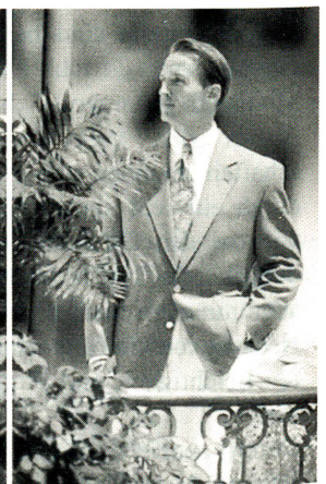
Elektronische Bildbearbeitung der Dias 1 und 2