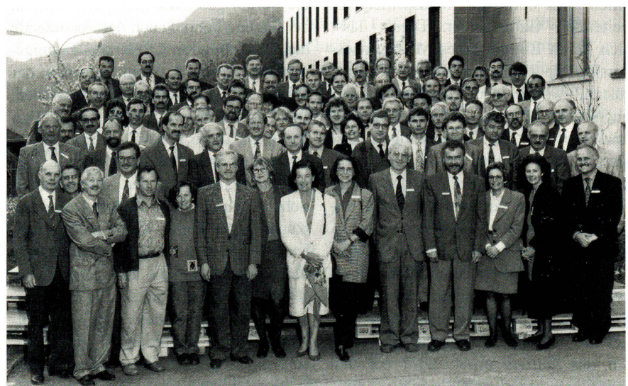
UT ■ Teilnehmer der IFWS-Tagung

Diese müssen drei wesentliche Anforderungen erfüllen: