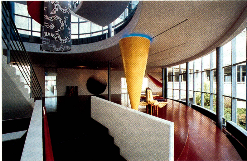
Innenansicht des neuen Personaleingangs. Gestalter: Susi und Ueli Berger, Ersigen.

Im Laufe der Systementwicklung kamen noch zwei weitere Wunschanforderungen hinzu. So sollten alle (oder zumindest mehrere) Stoffrollen des gleichen Colorits gemeinsam in einer Wanne zum Bearbeitungsplatz gebracht werden, wodurch die Zuschneiderin die «Feinauswahl» nach nicht computerisierbaren Aspekten selber treffen kann. Dies führte zur Lagerung