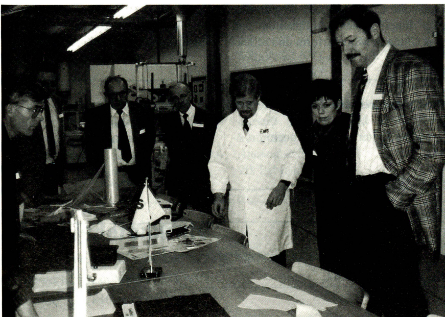
Demonstration im Anwendungstechnikum der EMS-Chemie AG

Im dritten, den Vortragsblock abschliessenden Beitrag, referierte H.