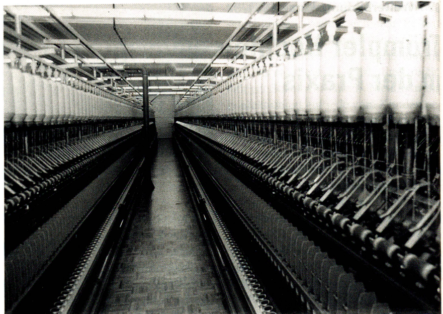
10 000 Spindeln mit Geschwindigkeiten von bis 21 000 Touren umfasst die neue Hi-Per-Spin-Anlage der Trümpler AG.