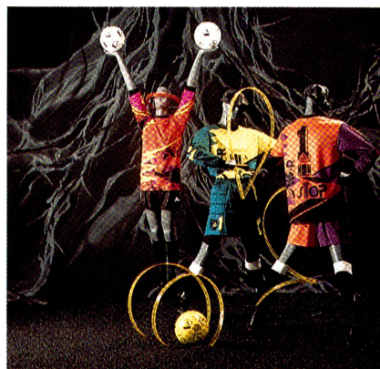
Teampol von Blacky beweist Zeit- und Teamgeist. Farb- und Dessinakzente mit Glanzeffekten sind zukunftsweisend für den Teamsport.

Die Neuentwicklung Rhonel Pontella verbreitert das Angebot von Rhône-Poulenc im Polyamid-Bereich. In den Kollektionen von fünf führenden Stoffherstellern finden sich grobe, knisternde Toiles mit oder ohne mikroporöse Beschichtung, die zu hochwertiger Skibekleidung und schicken Parkas verarbeitet werden.