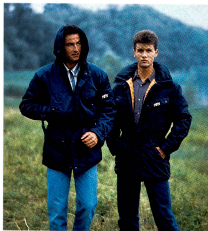
Sport- und Freizeitjacken von rukka sind universell einsetzbar. Ihre durchdachte Ausstattung mit funktionellen Details empfiehlt sich sowohl als Arbeitsbekleidung wie auch für den robusten Outdoorbereich.

den Einsatz Gymnastik, Leggings, Tights, Radsport u. a. Die zweiflächigen Textilien aus Rhonel Comforto mit Baumwolle an der Aussenseite sind in verschiedenen Programmen vertreten.