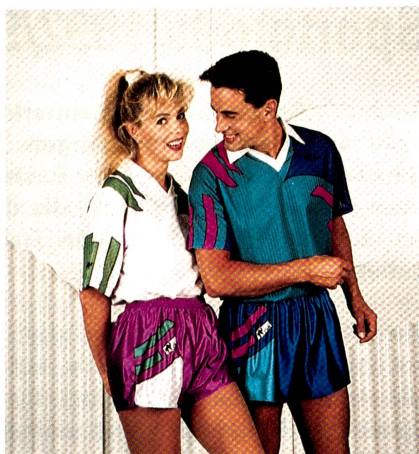
Im sportlich lässigen Partnerlook mit poppigen Farbspielen präsentiert sich die neue Cats Sportswear-Kollektion. Ballspieler setzen auf funktionelle Kleidung aus der zukunftsorientierten High-Tech-Konstruktion Tergal Comforto.

Bei den Comforto-Qualitäten besticht eine Neuentwicklung von Boos mit Elasthan, das heisst eine «Funktionsmasche» auf Kettenwirkbasis für