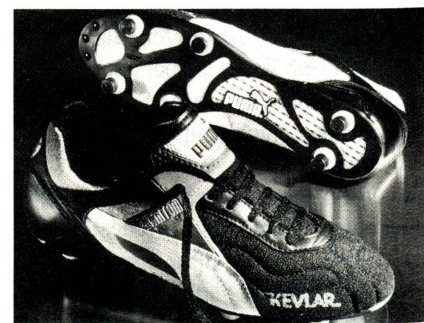
High-Tech für Fussballer dank Material-Neuentwicklung mit Kevlar.

verwendeten Material um eine Innovation. Die «Keptotec»-Faser, deren Bestandteil «Kevlar» ist, wurde ursprünglich von Schoeller als ein verbesserter Lederersatz für Motorradschutzkleidung entwickelt.