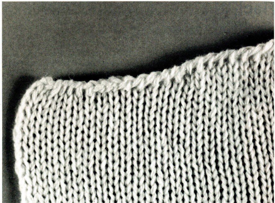
Die Flachstrickmaschine kettelt Formstrickteile ab, so dass diese rundum mit festen Kanten konfektionsfertig aus der Maschine kommen.

Bei Integral-Pullovern entfallen die Konfektionsgänge Vorbügeln, Zuschneiden und Ketteln der Halseinfassung. Taschen werden eingestrickt. Bei den Jacken auch die Knopflöcher an den Besätzen. Bei der Konfektion der Pullover sind praktisch nur noch zwei Seitennähte zu schliessen.