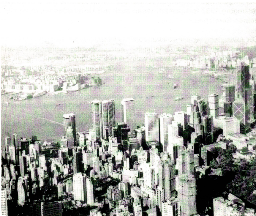
Hongkong – Dreh- und Angelpunkt der asiatischen Wirtschaft.

Die HKTDC-Büros ausserhalb Hongkong sind mit der Datenbank in der Zentrale verbunden und können Produktanfragen direkt weiterleiten. Aus rund 50 000 gespeicherten Herstellern, Importeuren und Exporteuren erhalten Interessenten Informationen zu geeigneten Geschäftspartnern in Hongkong. Ausserdem sind über 176 000 Einkäufer aus aller Welt gespeichert. Diese Datenbank wird ständig aktualisiert und erweitert.