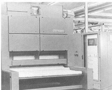
Flockenspeiser Exactafeed FBK 536 mit Vliesprofilregelung VPR.