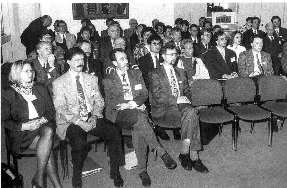
Gespannt verfolgen die Teilnehmer den Ausführungen der Referenten