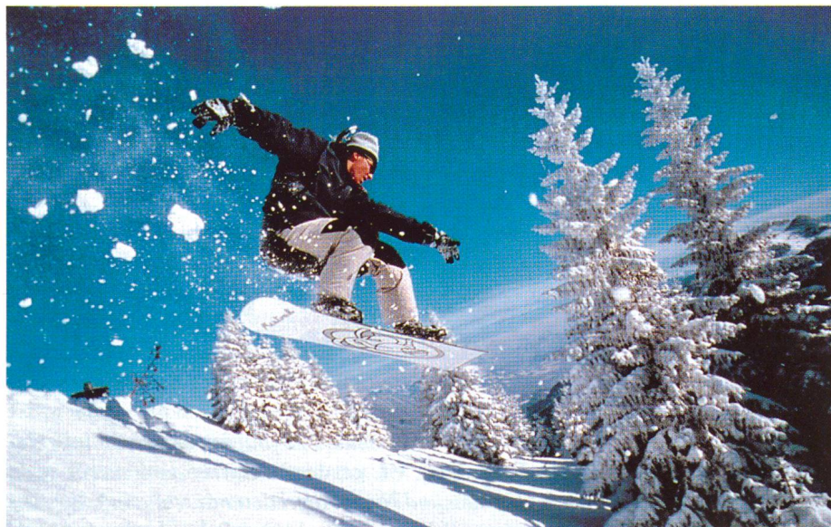
Snowboard-Boom: Mistral – cool und lässig sind Hosen und Jacken

vom 7. bis 10. Februar 1995 in München stattfand. Der Gesamt-Brutto-Produktionswert für die Sportartikel-, Camping- und Freizeit-Industrie betrug in Deutschland 1994 rund 5,305 Mrd. DM. Dabei entfielen auf Sportbekleidung und Sportschuhe rund 2 Mrd. und