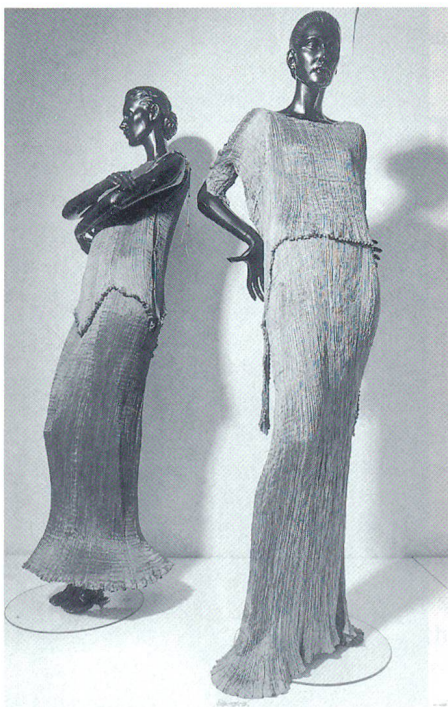
Mariano Fortuny (1871–1949), Italien. «Delphos», Seide, Venedig 1910/1930, Museum für Kunst und Gewerbe Hamburg.

Dass sich Polyester und andere Stoffe problemlos in Dauerfalten legen lassen, zum Beispiel von Issey Miyake oder Cristobal Balenciaga, dass jedoch Seide plissieren weiterhin das Geheimnis von Fortuny bleiben wird, dass Aldous Huxley unter dem Einfluss von Meskalin über Falten sinnierte – das und vieles mehr, kann in dem reich bebilderten, in kunstvolle Falten gelegten Katalog zur Ausstellung nachgelesen werden. CGF Die Ausstellung ist geöffnet, Di, Do, Fr 10–17, Mi 10–21, Sa und So 10–12, 14–17. Am Mittwoch um 19 Uhr finden jeweils Führungen statt.