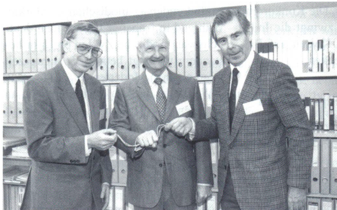
Symbolische Übergabe des Schlüssels zum Schaltschrank der Kompaktspinnanlage