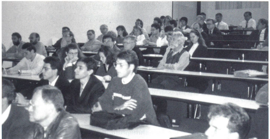
Gespannt verfolgen die Zuhörer die Präsentationen

len ermittelt werden. Die Beurteilung des Laufverhaltens erfolgt über eine neu entwickelte Software.