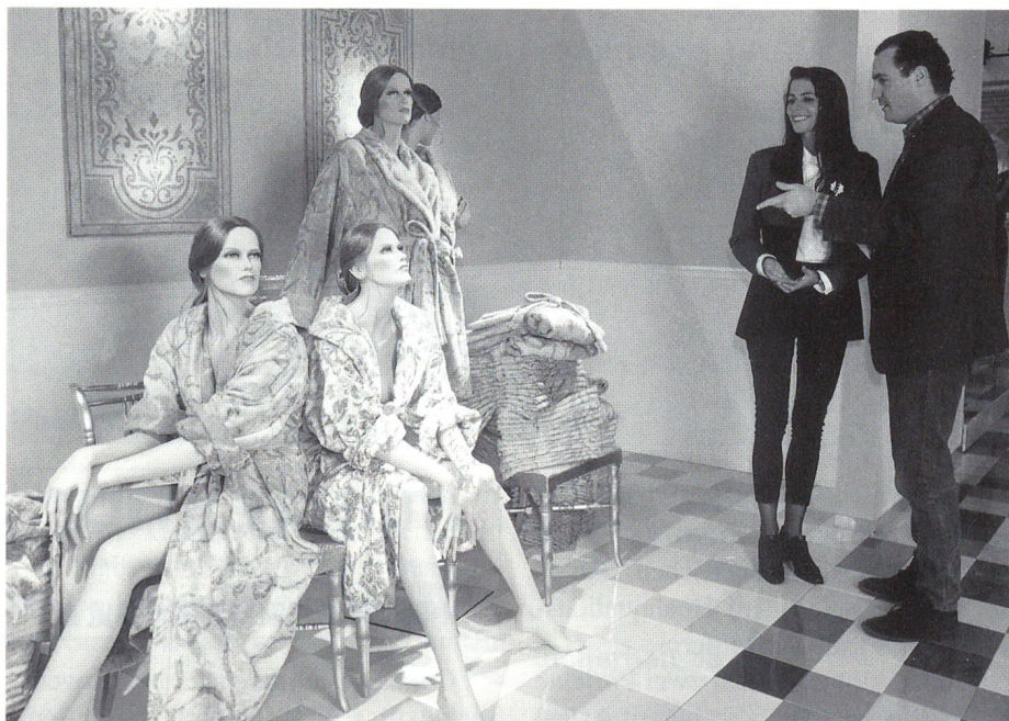
Heimtextil 1996: Erlebnisswelt Bad

Trends für 1996/97 wurden im «Dreamland» und im «Wonderland» ge-