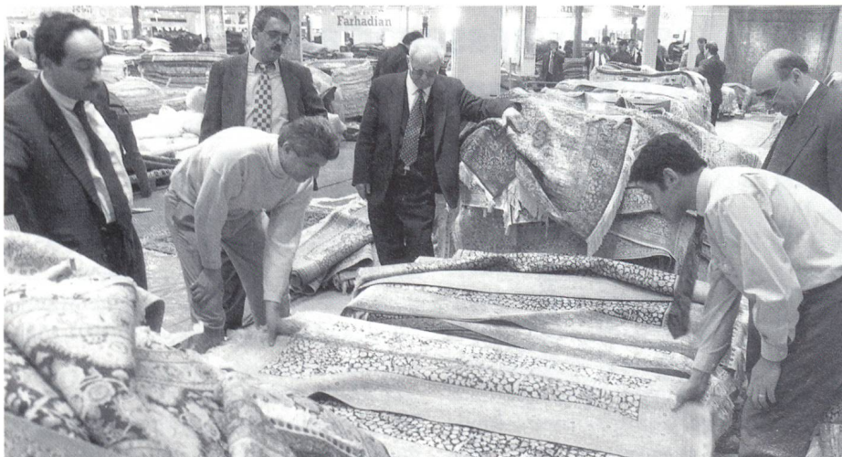
Kritische Begutachtung: Handgefertigte Teppiche

des Teppichs oder Teppichbodens im Wohn- und Büroambiente zunehmend an Bedeutung. Die jeweiligen Kollektionen bewiesen Mut zu ungewöhnli-