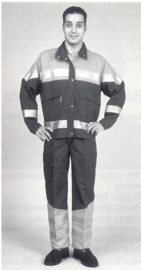
Warnbekleidung aus der High Visibility Line