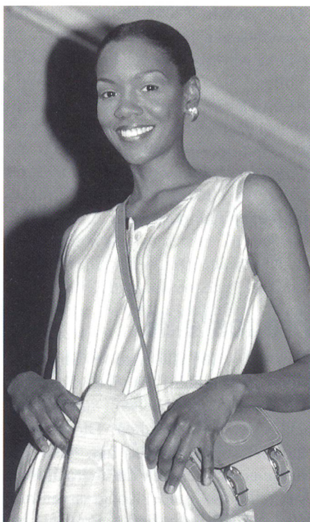
Mit konsequent natürlicher Kleidung in den Sommer 1996

sind zeitlos, langlebig, kombinierbar und lassen sich auch in einem darauffolgenden Jahr mit weiteren Stücken ergänzen. In Zusammenarbeit mit Universitäten und Instituten werden laufend weitere Naturprodukte erforscht, wie zum Beispiel Nessel- und andere Fasern, Pflanzenfarben und anderes.