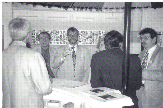
An der SVT-Bar standen «erfahrene Hasen» für die Mitglieder gewinnbereit