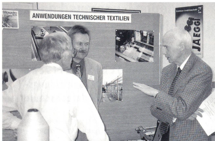
Angeregte Diskussionen zum Tag der offenen Tür