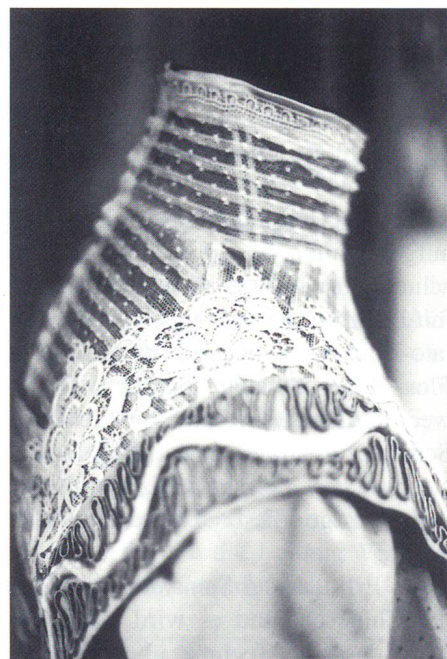
Anmut und Eleganz

«Anmut und Eleganz» zu sehen: Spitzen in der Damenmode von der Jahrhundertwende bis zu den 1960er Jahren. Für jede Robe war eine individuell gefertigte Figurine notwendig. Anhand einer kleinen Dokumentation ist ersichtlich, wie diese Figurinen in aufwendiger Handarbeit im hauseigenen Atelier entstanden sind. Zum Teil waren die gleichen Exponate bereits im Sommer 1995 in Dortmund in der Ausstellung «Spitze – Luxus zwischen Tradition und Avantgarde» ( mittex 5/1995, S. 46 ) zu sehen. Dazu sind erstmals aus dem der Textildibliothek geschenkten Nachlass von Walter Niggli (1908–1990) Modezeichnungen ausgestellt. Es ist eine Auswahl aus den 7500 Originalen, die den Kleiderstil der grossen Couturiers von 1933 bis 1985 widerspiegeln. Die letztjährige Ausstellung «Stickereiindustrie und Stickereientwurf um