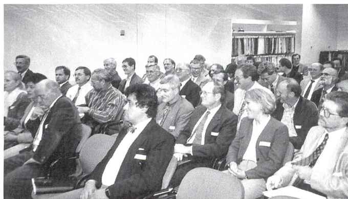
Die Teilnehmer am Weiterbildungskurs verfolgen aufmerksam die Präsentationen